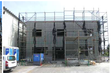
〔8/17撮影時〕：基礎工事が終わり、上棟工事がスタート！〔9/6撮影時〕：すっかり建物らしくなりました。これから内装・外装工事です！