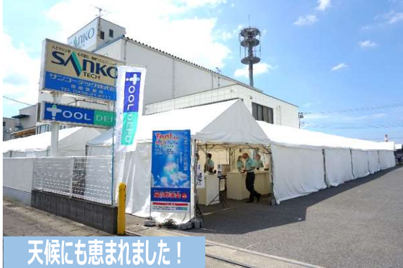
天候にも恵まれました！