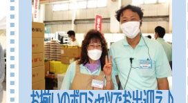
お揃いのポロシャツでお出迎え！

気になっていたあの商品を、初めて目にした新商品を、見て・聞いて・触って・体験して